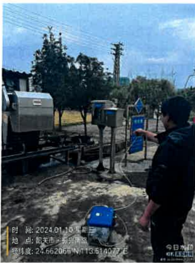
厂区内浓度最高点进水格栅旁 5#